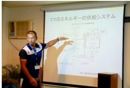
エネルギーの供給システムの解説