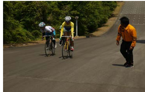
訓練施設の登坂走路