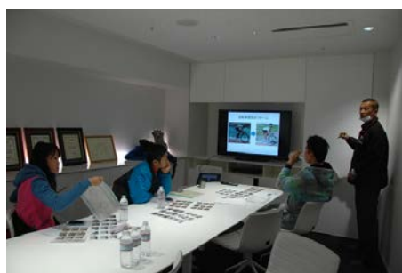
トレーニング効果を解説