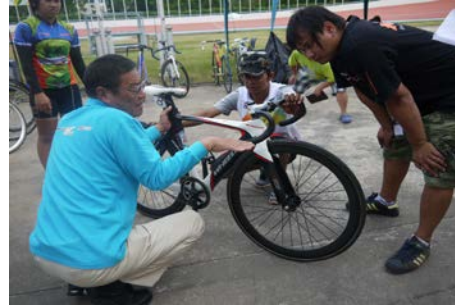
メンテナンス風景