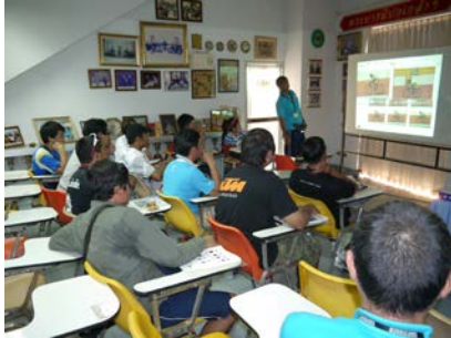
乗車フォームの解説