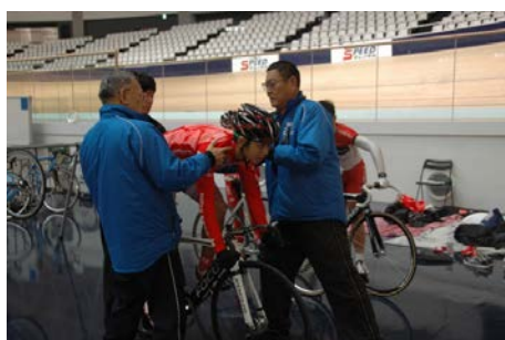
乗車フォーム・ペダリング修正