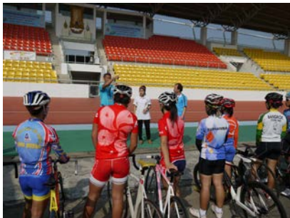
トラック実技指導