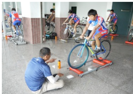
ローラー訓練ペダリング修正