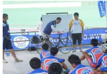
乗車フォームの解説