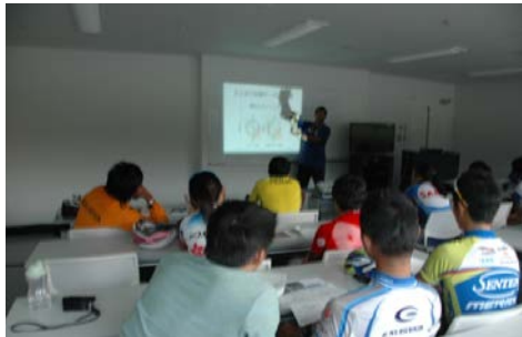
トレーニング効果を解説

内訳(香港チャイナ：選手2名、チャイニーズ台北：選手4名・コーチ2名、マレーシア：選手8名・コーチ2名、タイ王国：選手2名、インド：選手3名)